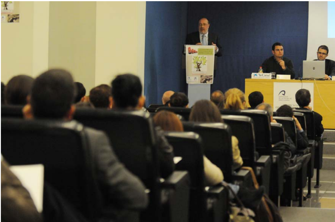
Jornada Claves para la continuidad de la empresa familiar