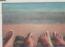
Cartel de 'Educanepl'