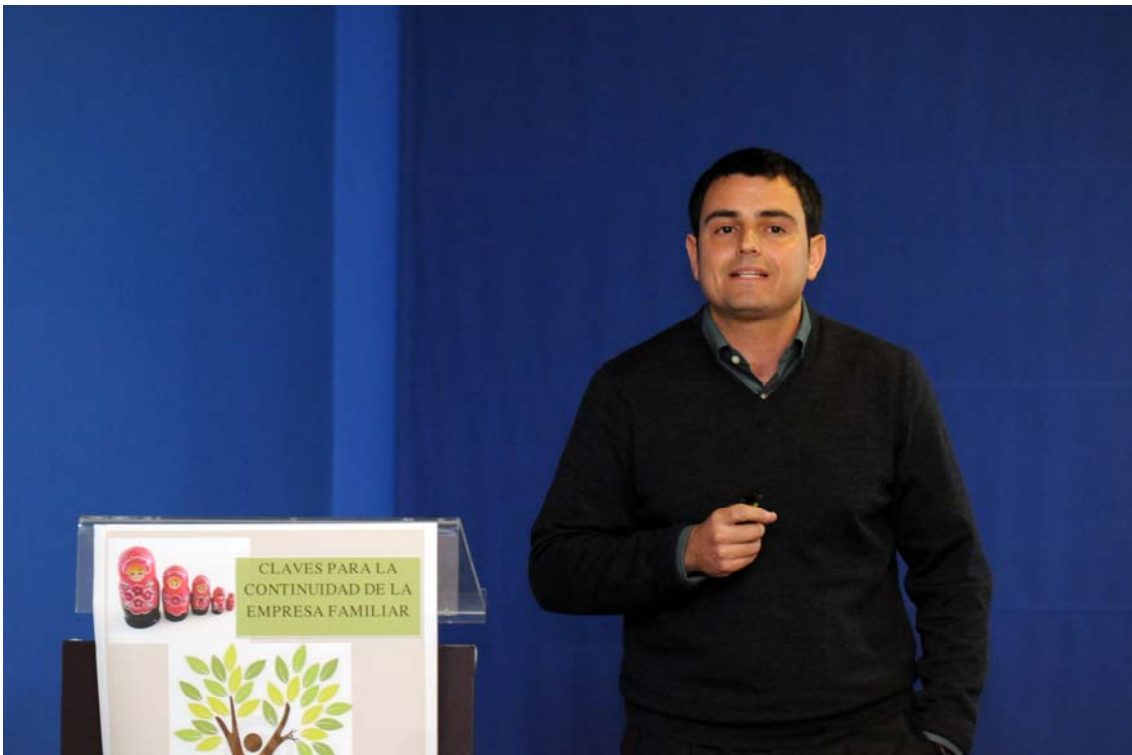
Jornada Claves para la continuidad de la empresa familiar