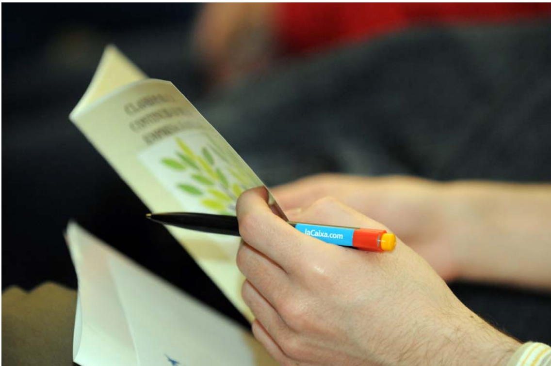
Jornada Claves para la continuidad de la empresa familiar